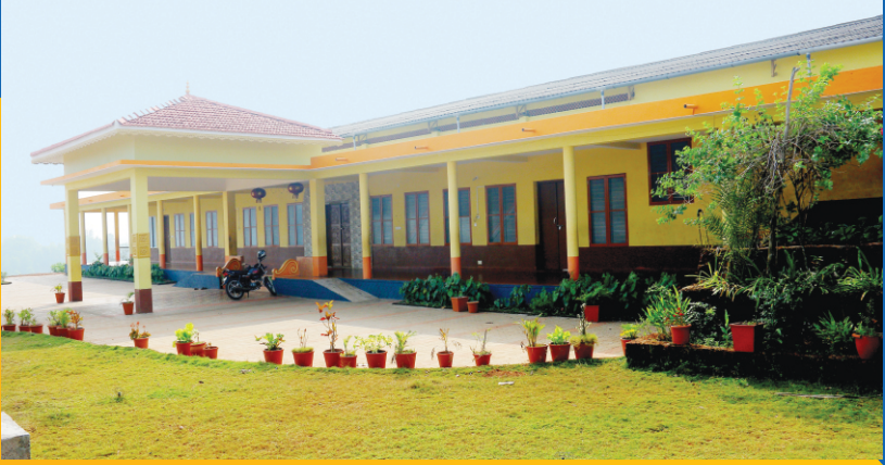
Prashanthi Prayer Hall